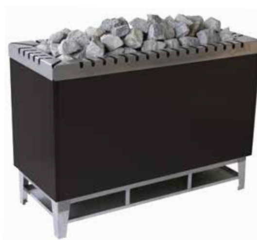
Тип 104 Мощность 32-36 кВт