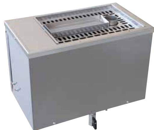
W 20 Мощность 3 кВт