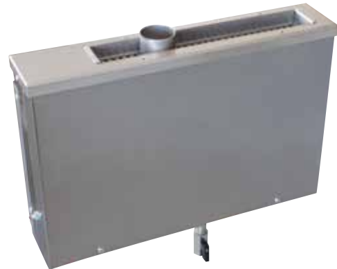
W 10 Мощность 1,5 кВт Нержавеющая сталь