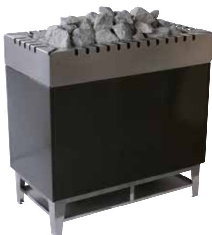
Тип 84-GSK Мощность 24-30 кВт